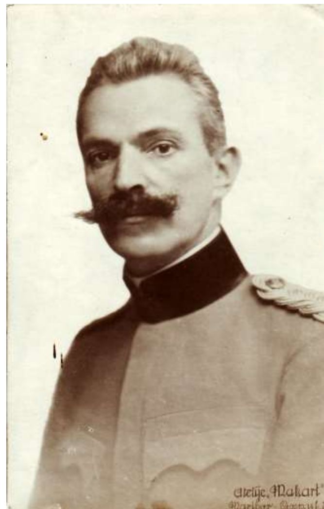
UKM, Zbirka drobnih tiskov