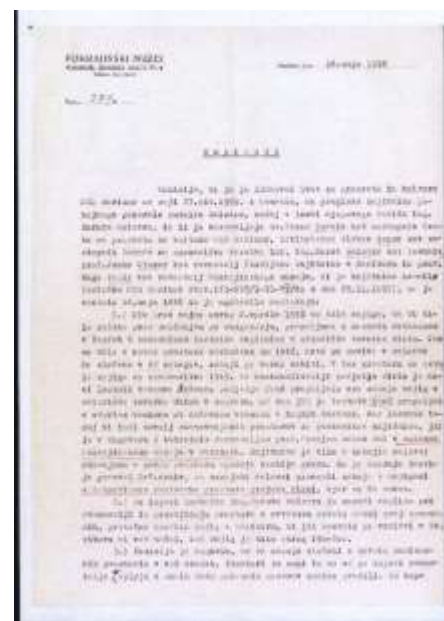
Ministrstvo za kulturo, Indok center, dokumenta postopku